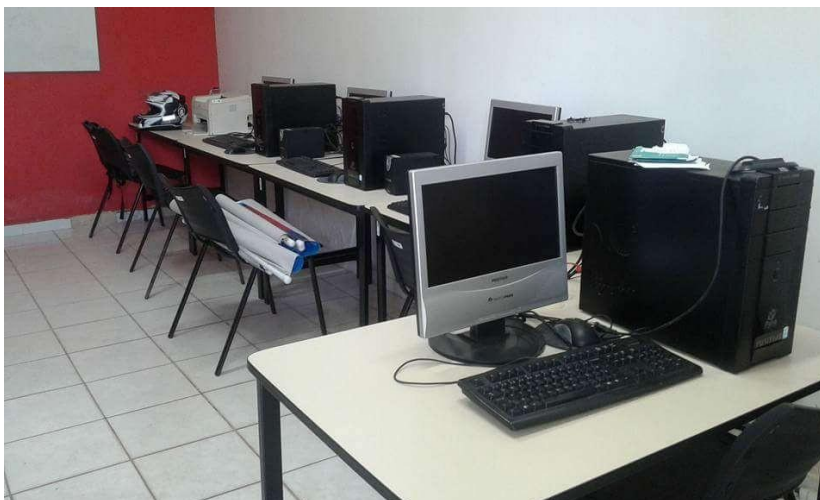
Figura 5: Fotografia dos computadores do Infocentro Ariri Bolonha.

perdendo vida útil. Até o momento da entrevista, o Centro Comunitário não obteve respostas da Secretaria referente ao Ofício. As atividades no Infocentro tiveram início em 2010 e terminaram em 2014. No entanto, em 2015 um técnico encaminhado pela PRODEPA compareceu ao local para realizar apenas o inventário físico e patrimonial do estado.